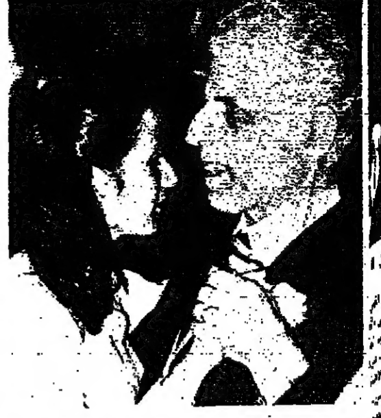
وحدة جامعة .. بين الاسماء والطالبة